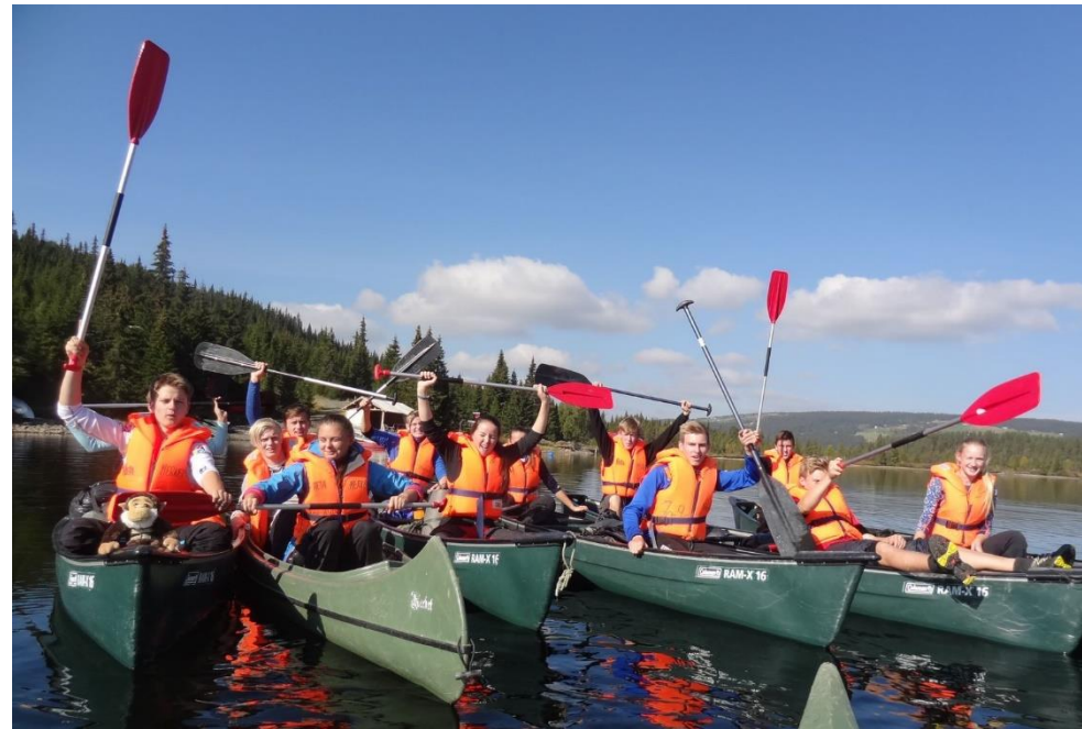
1.klasse ved idrettslinja på ekskursjon. Kanotur ved Merket på høsten i vg1.